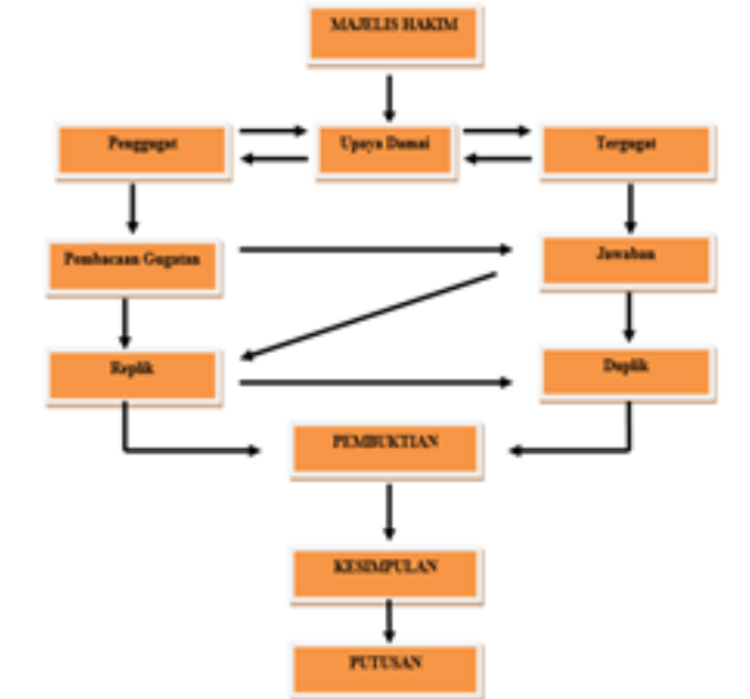
Gambar 7.1 Tahapan Pemeriksaan Persidangan

Mekanisme pemeriksaan perkara Peradilan Agama yang dilakukan di depan sidang Pengadilan secara sistematis harus melalui beberapa tahap berikut, yakni: 1) melakukan perdamaian antar kedua belah pihak yang berperkara; 2) pembacaan surat gugatan/permohonan, 3) jawaban tergugat/termohon, 4) Replik (tangkisan atas jawaban) dari Penggugat/ Pemohon, 5) Duplik dari tergugat/termohon (tangkisan atas replik), 6) Pembuktian, 7) Kesimpulan, 8) tahap putusan atau penetapan dari Majelis Hakim.